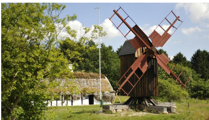
Se møllevingerne dreje på Youtube